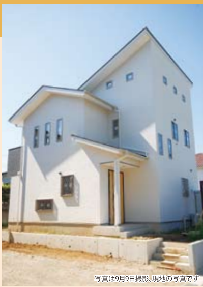
写真は9月9日撮影、現地の写真です