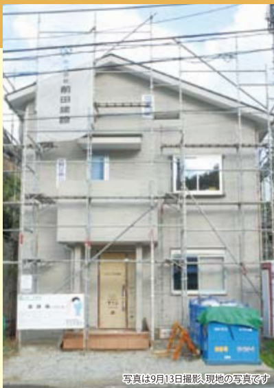
写真は9月13日撮影、現地の写真です